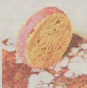
Humří klepeto v omáčce z červené řepy a hovězí tatarák

toru zní tichý hlas Niny Simone a manažer restaurace je oblečen v džínách a blejzru. Tahle restaurace zkrátka dokáže své ceny ospravedlnit i bez blýskavých rekvizit.